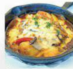
アグー豚と和牛の ハンバーグデミグラスソース Agu-pork and beef hamburger steak with demi-glace sauce ¥1,800