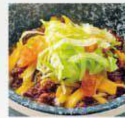
タコライス Taco rice ¥1,400