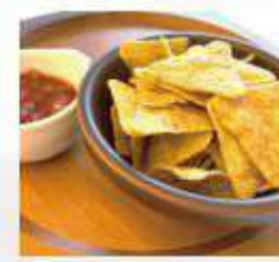
トルティーヤチップス サルサソース添え Tortilla chips with salsa sauce ¥450