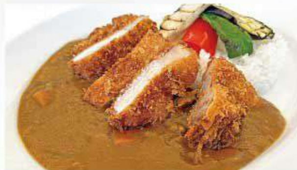
アグー豚の カツレツカレー Agu-Pork cutlet curry with Rice ¥1,800