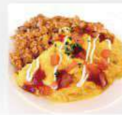
とろとろオムライス Omelet rice ¥1,000