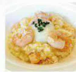
エビと半熟卵の チーズリゾット Shrimp and soft boiled egg risotto ¥1,000