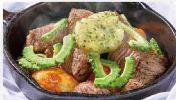
牛サイコロステーキ ガーリック風味 Beef garlic steak ¥1,800