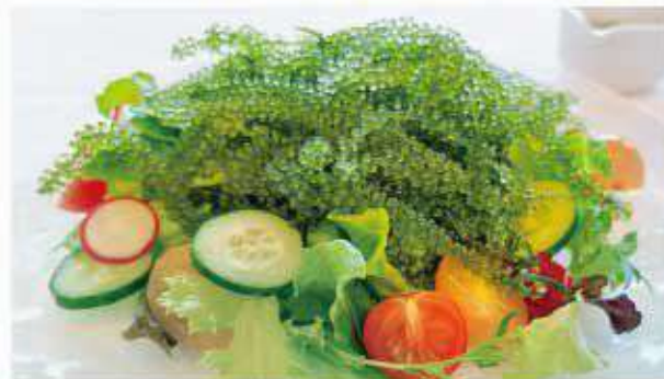
海ぶどうサラダ Seagrape salad ¥1,400