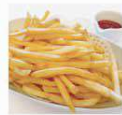
フライドポテト French fries ¥600