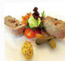
パテ・ド・カンパーニュ Pate de campagne ¥2,200