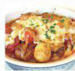
ミートボールとポテトの チーズ焼き Cheese gilled meatball and potato ¥1,000