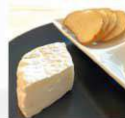
カマンベールチーズ クルトン添え Camembert cheese ¥450