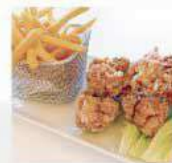
フライドチキン & フライドポテト Fried chicken & French fries ¥1,600