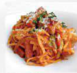
沖縄そばナポリタン Ketchup-based fried Okinawan noodles ¥1,600