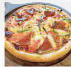
ミックスピザ Combination Pizza ¥1,800