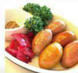
ソーセージ盛り合わせ Assorted Sausages ¥1,600